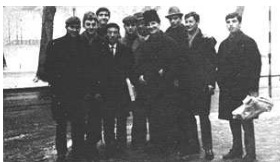
Murakami avec certains de ses étudiants de karaté à Zagreb

Quand vous le voyez dans son costume bleu-foncé vous pensez : quel petit homme". Mais quand vous le voyez dans son