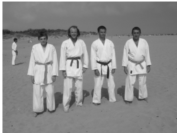
Les représentants au stage de Sérignan 2004

Contact : Tel 03 87 58 81 70 Email : laurealex@tiscali.fr